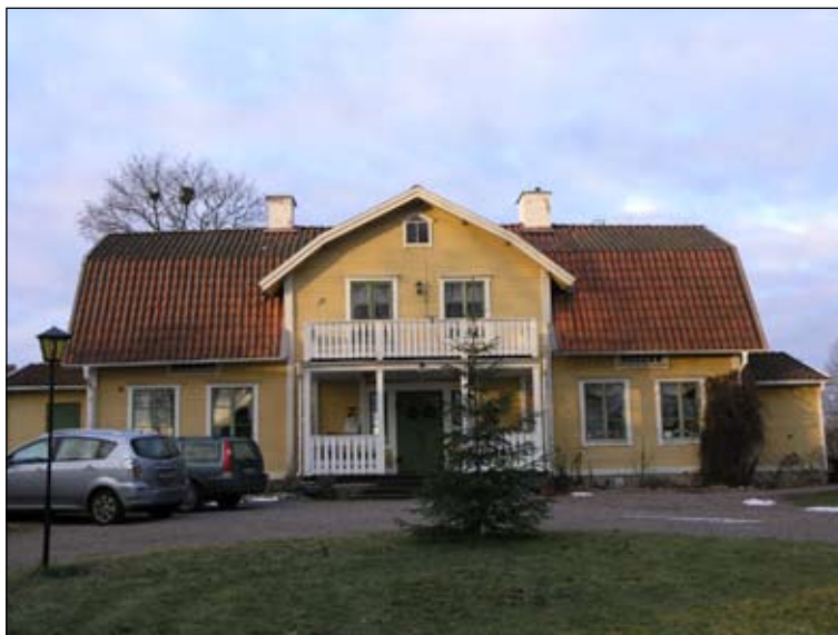
Bildbeteckning: lp2005-1327. Mangårdsbyggnaden från öster.

Från ombyggnaden på 1980-talet härrör dörr- och fönsterfoder samt golvsocklar.