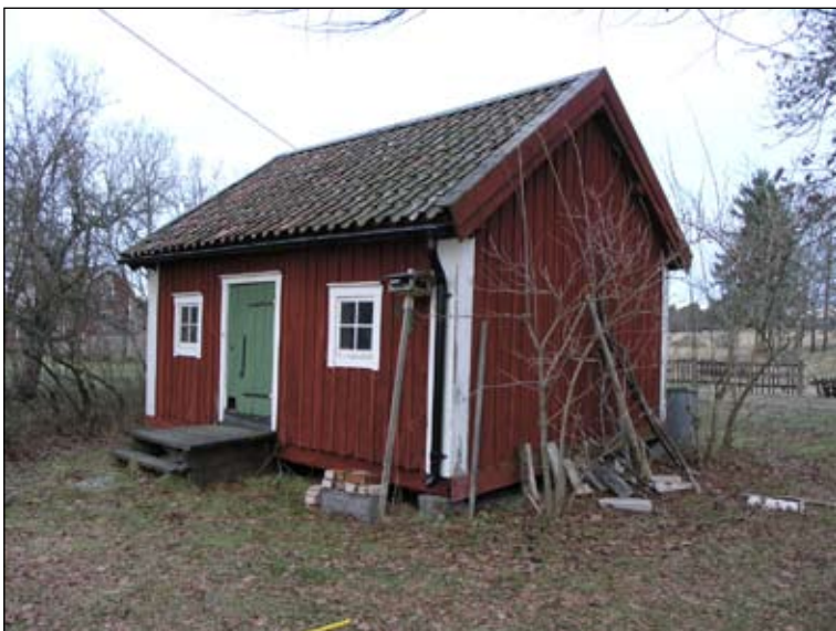
Bildbeteckning: lp2005-1328. Vedboden från sydöst.

Byggnaden finns med på skifteskartan från år 1765 men var då belägen närmare manbyggnaden. År 1910 flyttades den till sin nuvarande plats. 2 Enligt uppgift blev byggnaden rullad till sin nuvarande plats oförändrad. Flytten av byggnaden sammanföll säkerligen med ändring av användning från matbod till vedbod och därmed insättning av fönster. Panelningen kan ha tillkommit samtidigt.