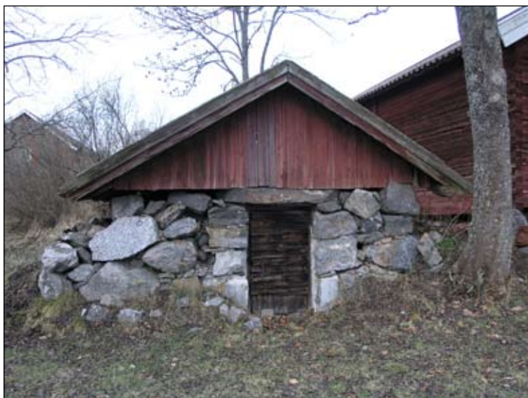
Bildbeteckning: lp2005-1332. Stenkällaren från öster.