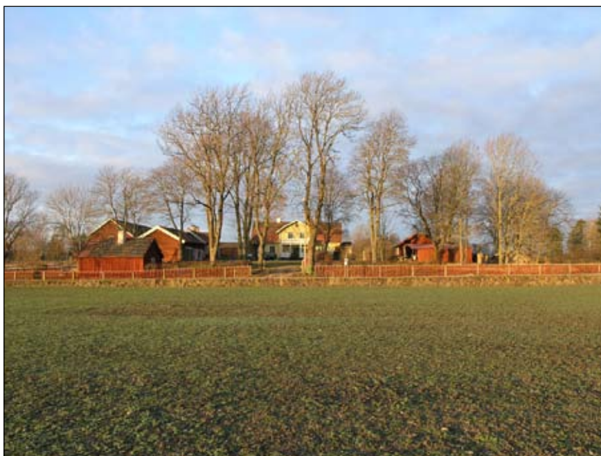
Bildbeteckning: lp2005-1326. Vidbo prästgård från öster.

Nedan beskrivs byggnaderna kortfattat i text och bild. Mer information om byggnaderna finns som ovan nämnts i bilagda inventeringsblanketter.