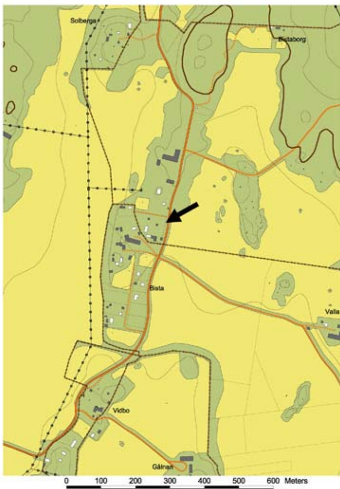
Utsnitt ur digitala fastighetnkartan, Sigtuna, med Vidbo prästgård markerad.

Historiken bygger på uppgifter och material ur litteratur och äldre inventeringar som presenteras i källförteckningen.