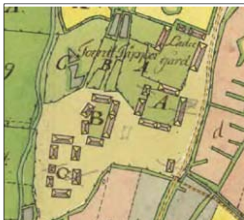
Utsnitt ur storskifteskarta över Bista by år 1745

Vidbo prästgård är belägen i Bista by, norr om Vidbo kyrka. Förutom prästgården består byn sedan äldre tid av ytterligare två gårdar. Bebyggelsen är belägen på en höjd, omgiven av åkermark invid den gamla landsvägen mellan Husby-Långhundra och Norrsunda.