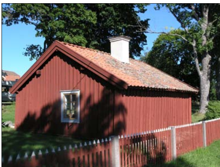
Bildbeteckning: lp2005-1331. Brygg- och bagarstugan från söder.

Brygg- och bagarstugan finns inte med på 1765-års skifteskarta. Vid 1970-talets inventering daterades byggnaden till 1800-1850. Byggnaden restaurerades år 2003. Enligt önskemål från fastighetsägarna uppmurades inte tvättkärlet vid restaureringen.