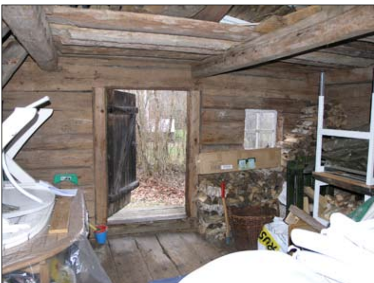
Bildbeteckning: lp2005-1329. Interiör, vedboden från norr.