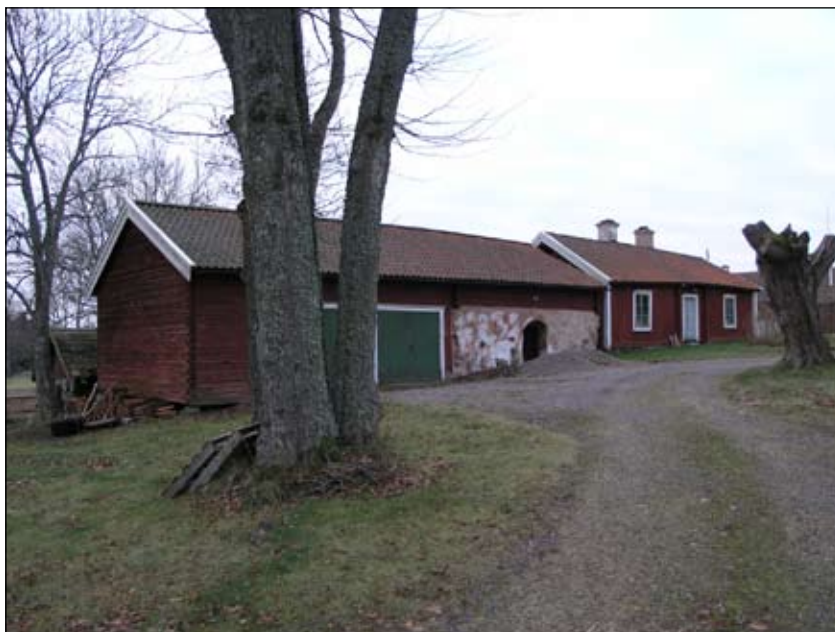
Bildbeteckning: lp2005-1333. Längan med f d stall, källare och arrendatorsbostad från nordost.