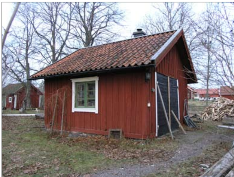
Bildbeteckning: lp2005-1330. F d drängstugan från sydöst.

Vid 1970-talets inventering har byggnaden daterats till 1800-tal. Vid tillfället fanns en vitputsad öppen spis. Byggnaden är helt moderniserad invändigt och innrymmer vedpanna. I prästgårdsinventeringen år 1917 benämns byggnaden slöjdbod.